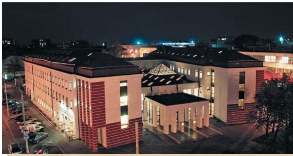
Dom Kultury Polskiej w Wilnie, ul. Naugarduko 76