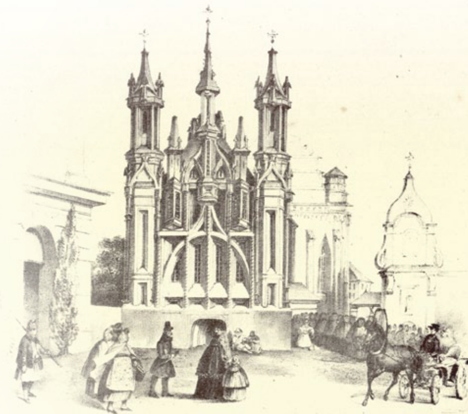
Wilno, kościół św. Anny, z albumu Przypomnienie Wilna , 1837, ryt. Kazimierz Bachmatowicz