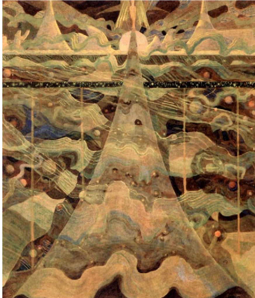
Mikalojus Konstantinas Čiurlionis, Szósta Sonata Gwiezdna , Andante, 1908 — Państwowe Muzeum Sztuki M.K. Čiurlionisa, Kowno

WYDZIAŁ FILOLOGICZNY UNIwersYTETU W BIAŁYMSTOKU KATEDRA BADAŃ FILOLOGICZNYCH „WSCHÓD – ZACHÓD” WYDZIAŁ FILOLOGICZNY UNIwersYTETU MIKOŁAJA KOPERNIKA W TORUNIU ZAKŁAD FOLKLORYSTYKI I LITERATURY POPULARNEJ KATEDRY KULTUROZNAWSTWA A. BARANAUSKO IR A. VIENUOLIO-ŽUKAUSKO MEMORIALINIS MUZIEJUS DZIAŁ NAUKOWY KSIĄŻNICY PODLASKIEJ IM. ŁUKASZA GÓRNICKEGO