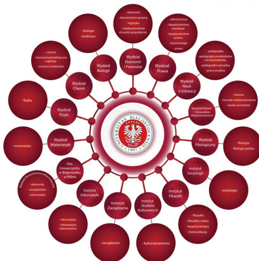
Nowa struktura UwB od roku 2019/2020

Uniwersytet w Białymstoku funkcjonuje w obecnej formie i pod tą nazwą od stosunkowo niedawna, bo od 1997 roku. Wcześniej (od 1968 roku) był filią Uniwersytetu Warszawskiego, co oprócz zapisów formalnych wiązało się też z tym, że wielu prowadzących koordynowało zajęcia w Warszawie, a także w Białymstoku. Ciekawostka: w dalszym ciągu niektórzy dłużej profesoria dojeżdżają do Białegostoku z Warszawy kilka razy w tygodniu. UwB na początku swojego istnienia składało się z zaledwie 5 wydziałów, w tym momencie jest ich 9, a dodatkowo funkcjonuje 5 instytutów i Filia Uniwersytetu w Białymstoku w Wilnie (warto podkreślić, że UwB jako jedyny uniwersytet w Polsce ma swoją filię zagraniczną ).