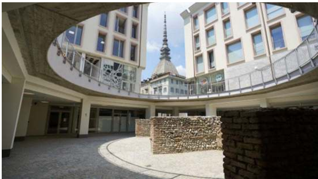
University of Turin, Complesso Aldo Moro