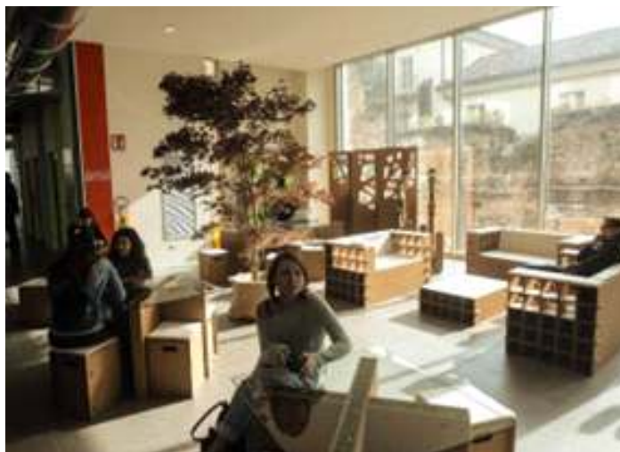
University of Turin Department of Foreign Languages, Literatures and Modern Cultures Complesso Aldo Moro