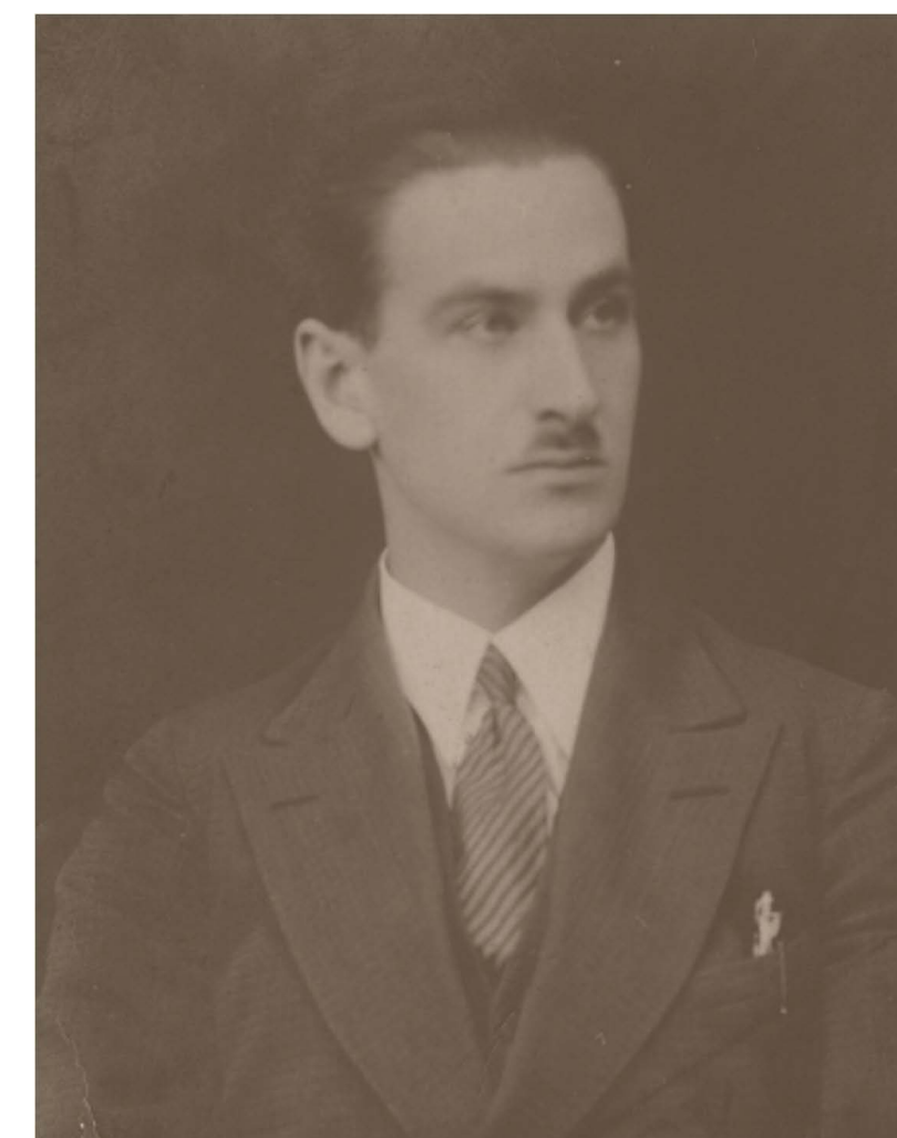
Józef Mackiewicz, Wilno, 1923 r.