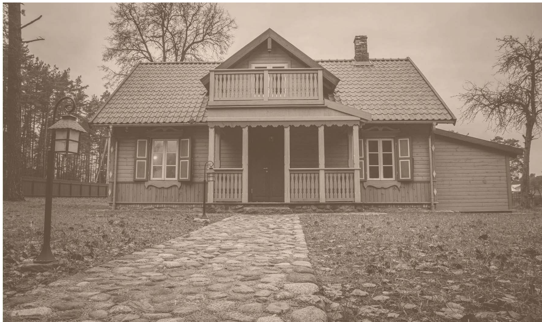
Dom Józefa Mackiewicza

Toporska i Mackiewicz powoli powracali do oficjalnego obiegu czytelniczego. W roku ubiegłym Sejm RP ustanowił rok 2022 „Rokiem Józefa Mackiewicza”, a liczne wydarzenia naukowe i kulturalne w kraju i za granicą przyczyniły się do popularyzacji twórczości i wzrostu zainteresowania