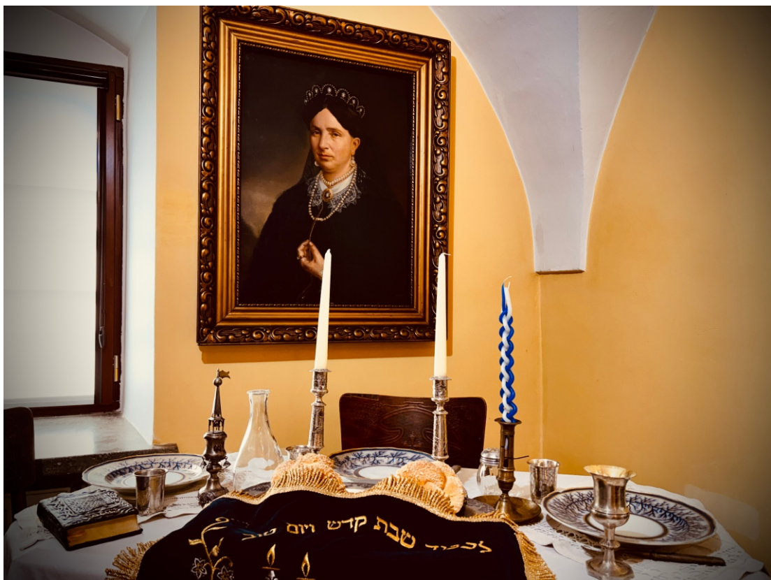
Aranżacja stołu szabatowego na wystawie stałej w Synagodze z obrazem Franciszka Smuglewicza (1745–1807) Portret Żydówki w stroju szabasowym ze zbiorów Muzeum w Tykocinie.