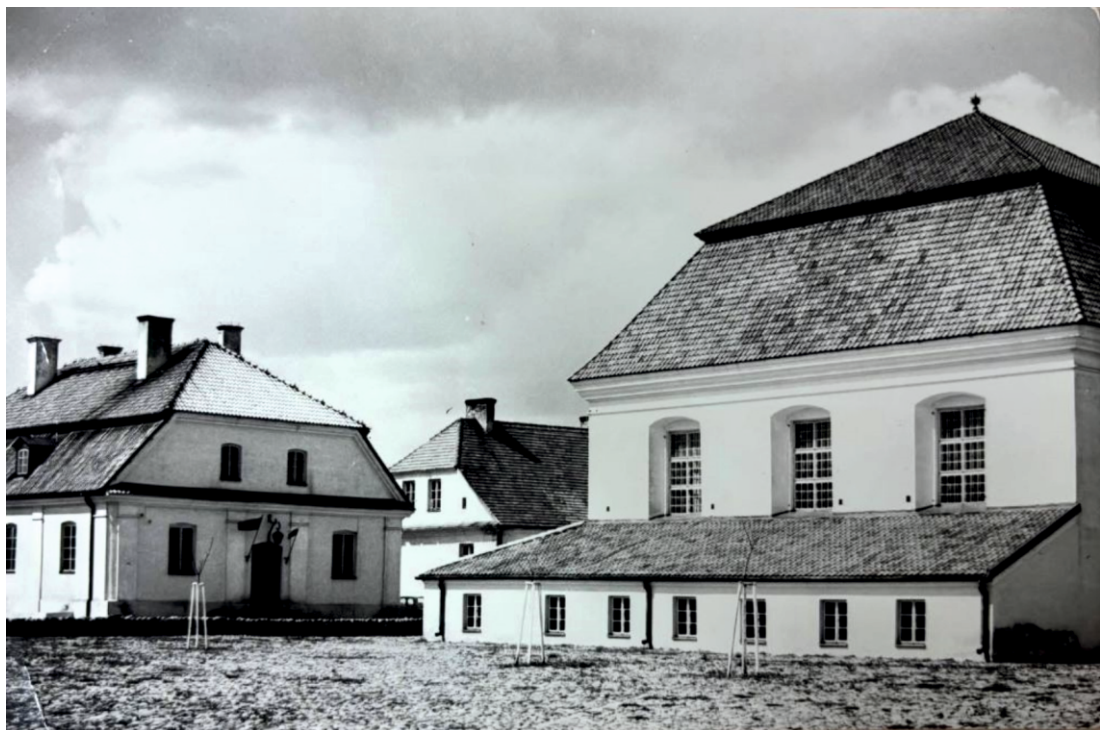
Odnowiona Synagoga i odbudowany Dom Talmudyczny jako siedziba świeżo utworzonego Muzeum w Tykocinie (druga połowa lat 70. XX w.)