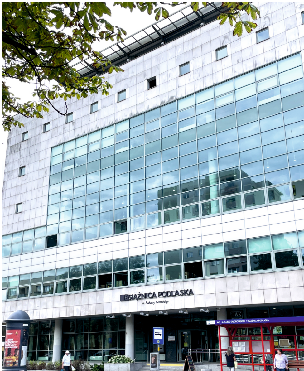
Gmach główny Książnicy Podlaskiej w Białymstoku, ul. M. Curie-Skłodowskiej 14a