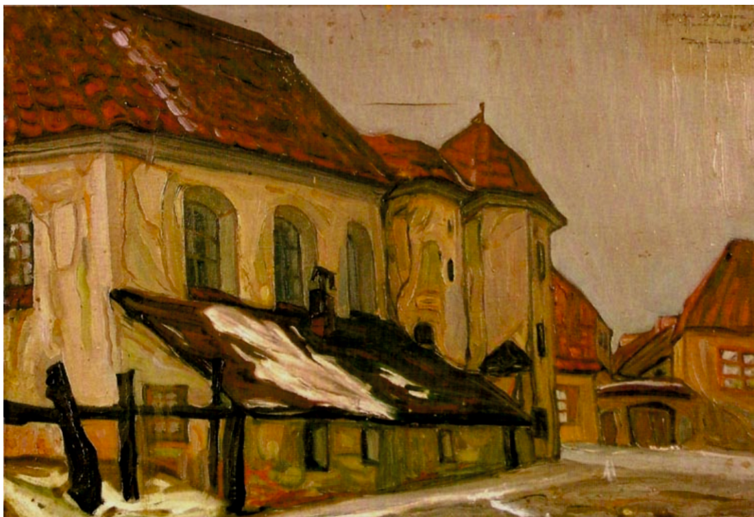
Zygmunt Bujnowski (1895–1927), Stara Synagoga w Tykocinie , 1926