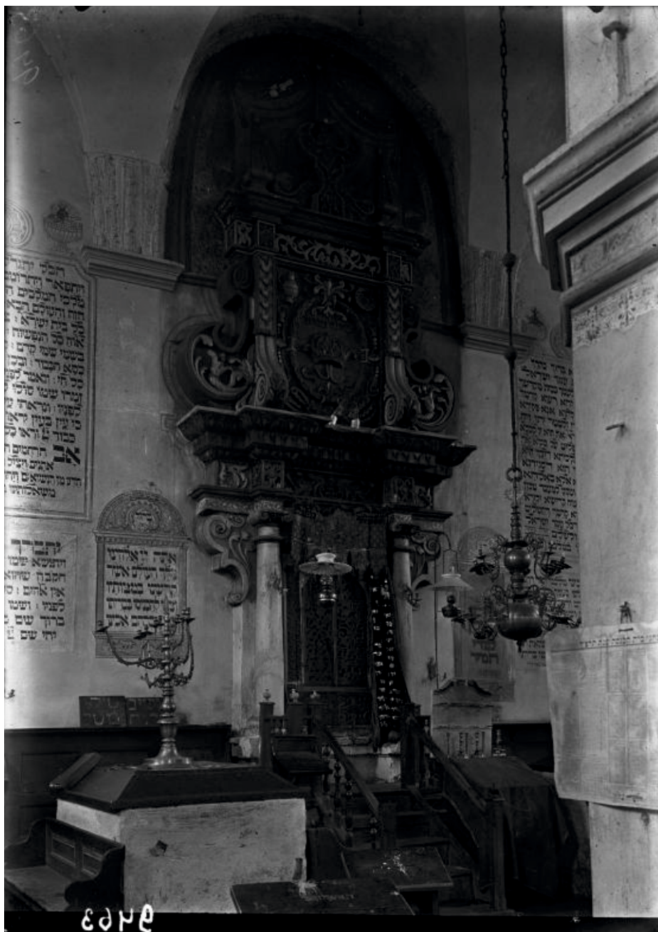
Wnętrze Synagogi w Tykocinie, fot. sprzed 1939 r. (z zasobów Instytutu Sztuki PAN autorstwa Szymona Zajczyka)