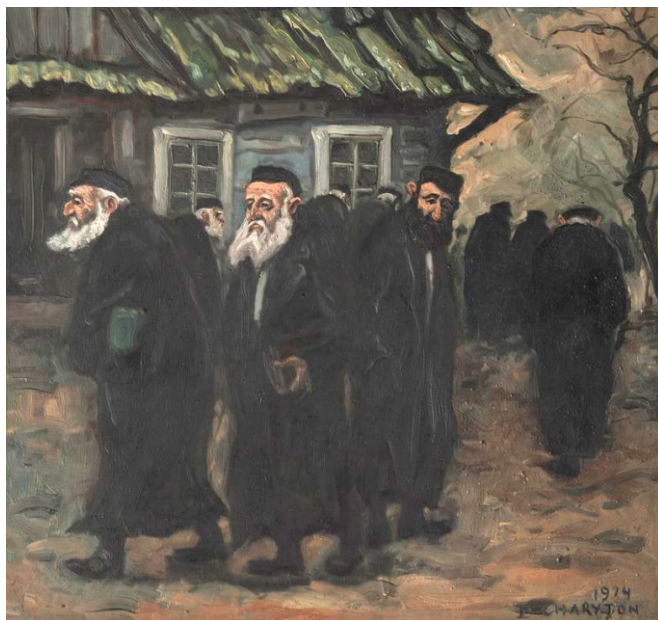
Żydzi pod chałupą, olej, płyta pilśniowa, 1974