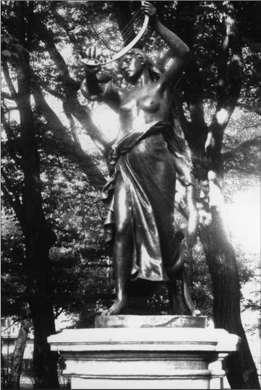
Pomnik Lilli Wenedy na krakowskich Plantach autorstwa Alfreda Dauna, CC BY-SA 4.0