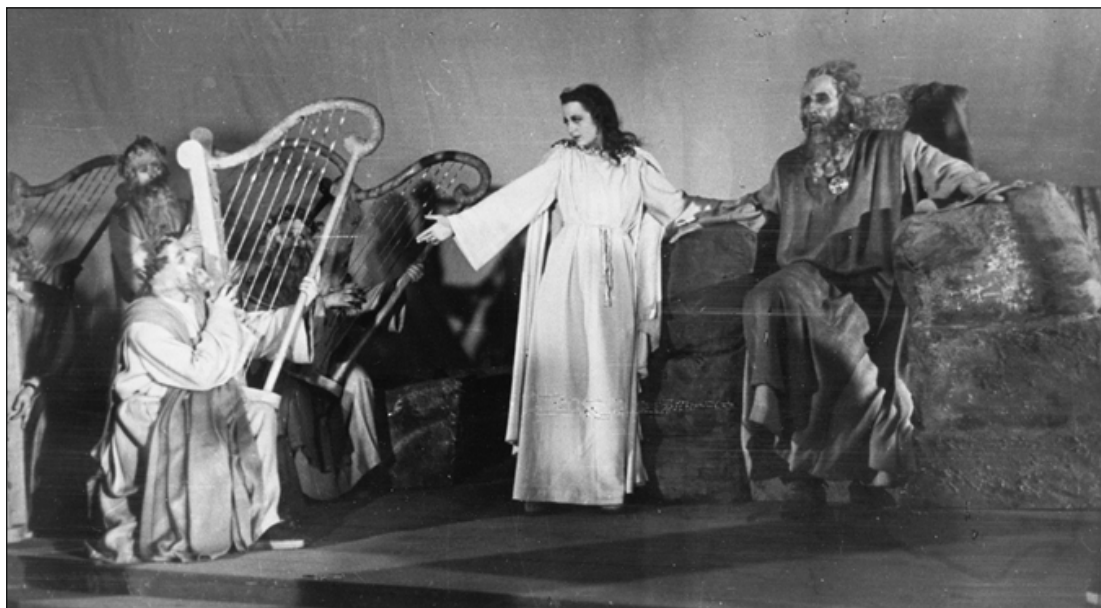
Pierwszy po wojnie spektakl w Teatrze Polskim – Lilla Weneda Juliusza Słowackiego w reżyserii Juliusza Osterwy. Na zdjęciu: Elżbieta Barszczewska w roli tytułowej i Gustaw Buszyński jako harfiarz Derwid, Warszawa, 17.01.1946 r.

Zdjęcie na okładce: Elżbieta Barszczewska jako Lilla Weneda, Warszawa 17.01.1946, fot. z Archiwum Teatru Polskiego w Warszawie.