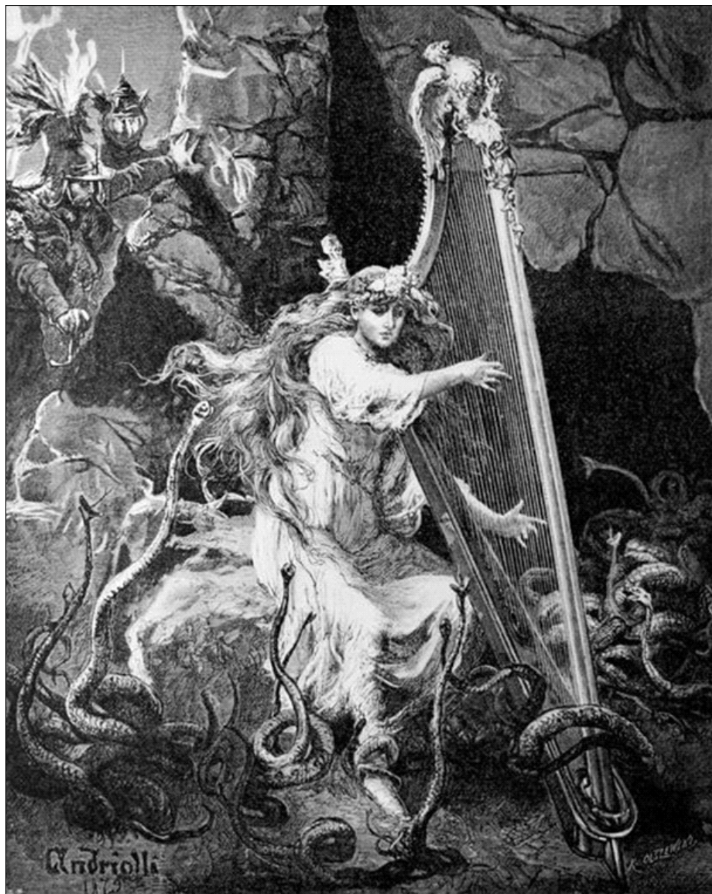
Michał Elwiro Andrioli, ilustracja wg. Juliusz Słowacki, Lilla Weneda , Warszawa 1883, s. 47