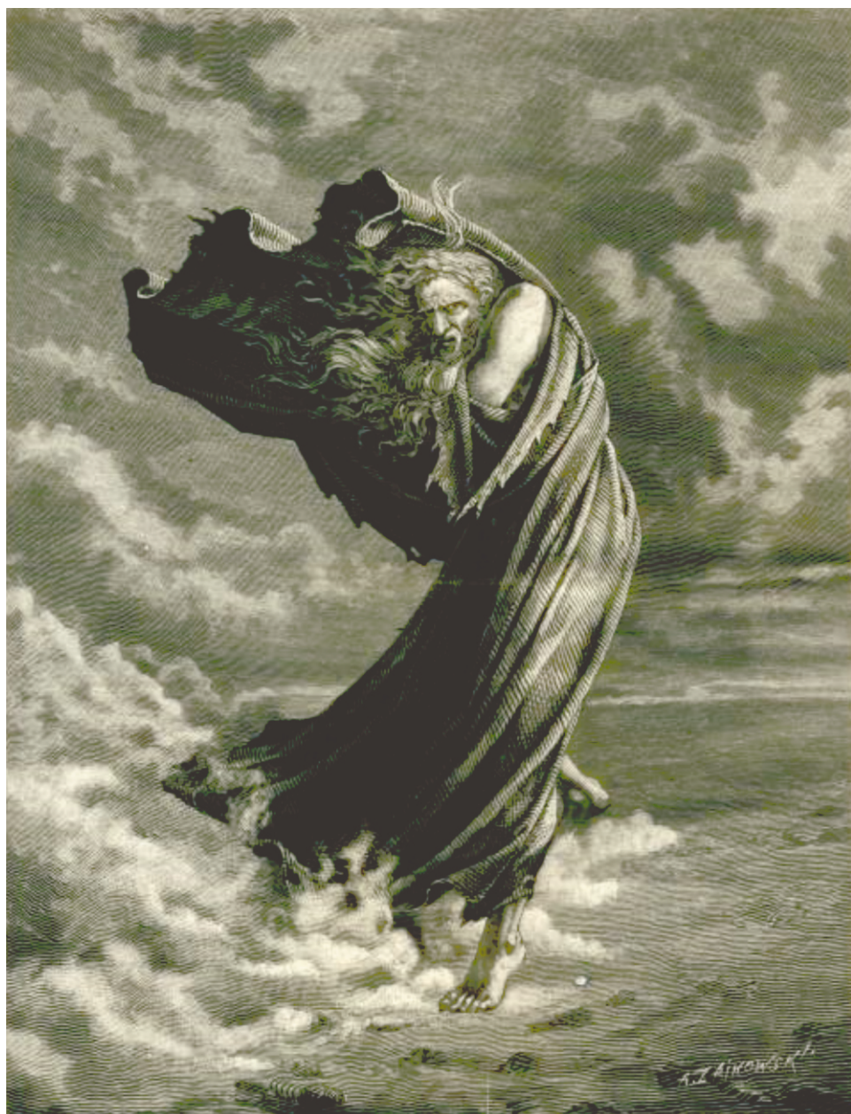
Wojciech Grabowski (1850–1885), Żyd wieczny tułacz , rysunek, 1876