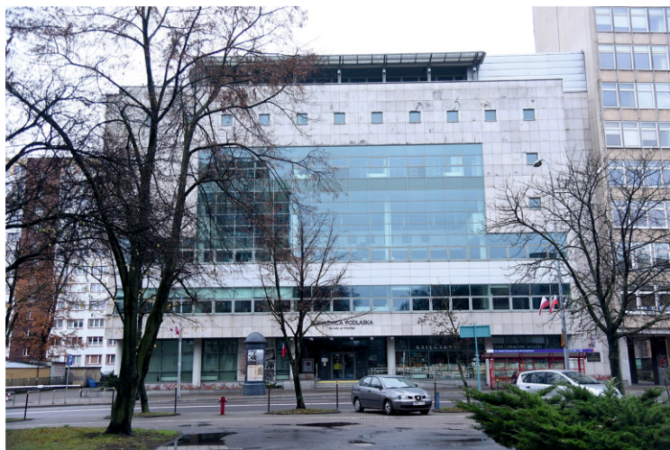
Książnica Podlaska im. Łukasza Górnickiego w Białymstoku