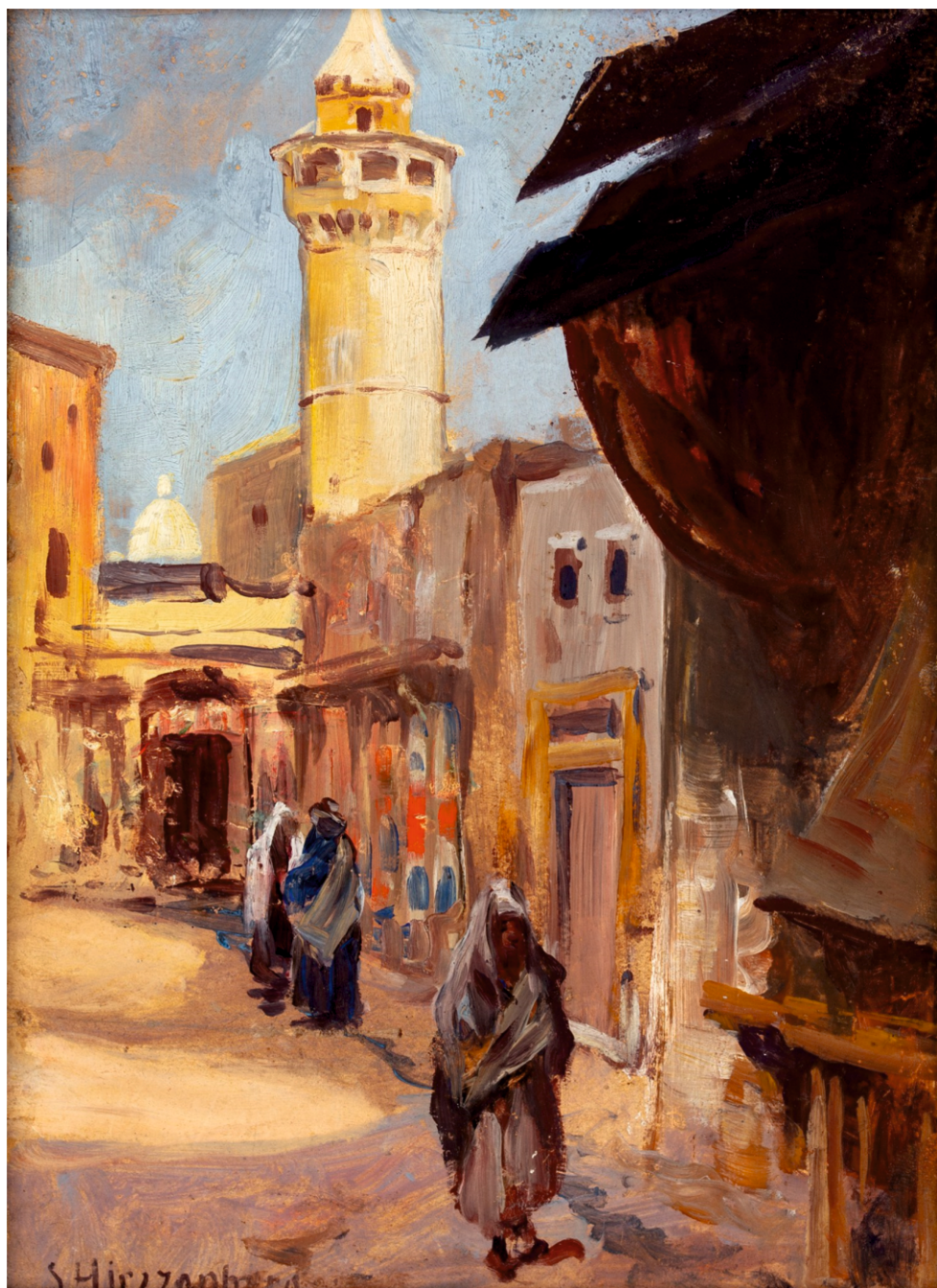
Samuel Hirszenberg (1865–1908), Z Jerozolimy , po 1907 r.