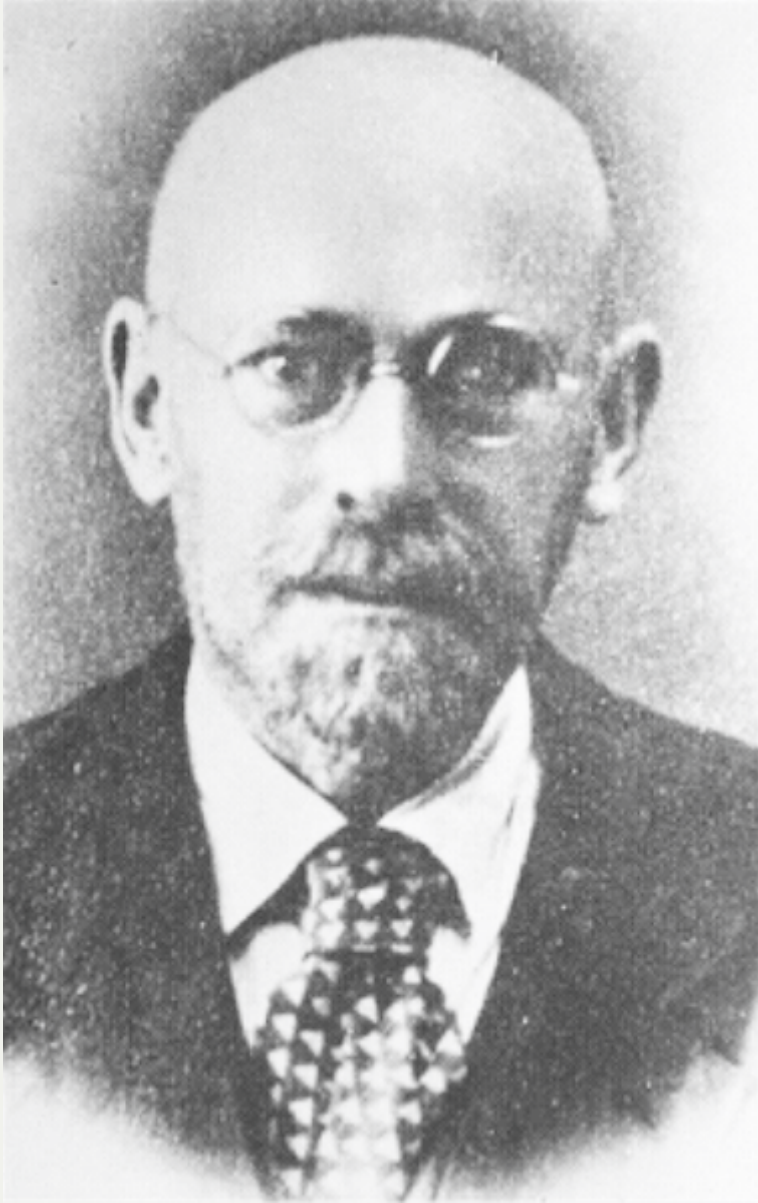
Janusz Korczak (1879–1942)