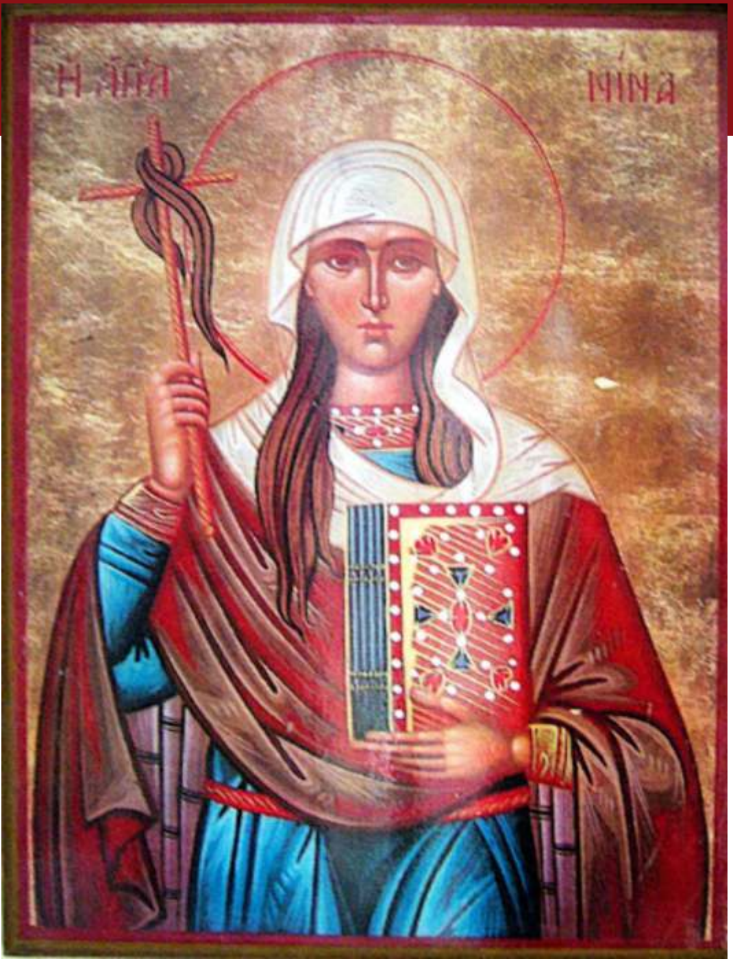
Św. Nino, apostołka, patronka Gruzji