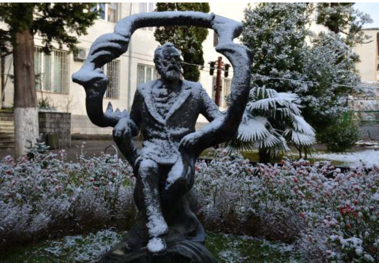
აკაკი ცერეტელის ძეგლი ქუთაისში, აკაკი ცერეტელის სახელმწიფო უნივერსიტეტის სასახლეში