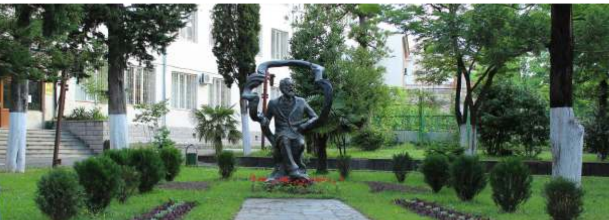
Pomnik Akakiego Ceretelego w dworcu Państwowego Uniwersytetu Akakiego Ceretelego w Kutaisi