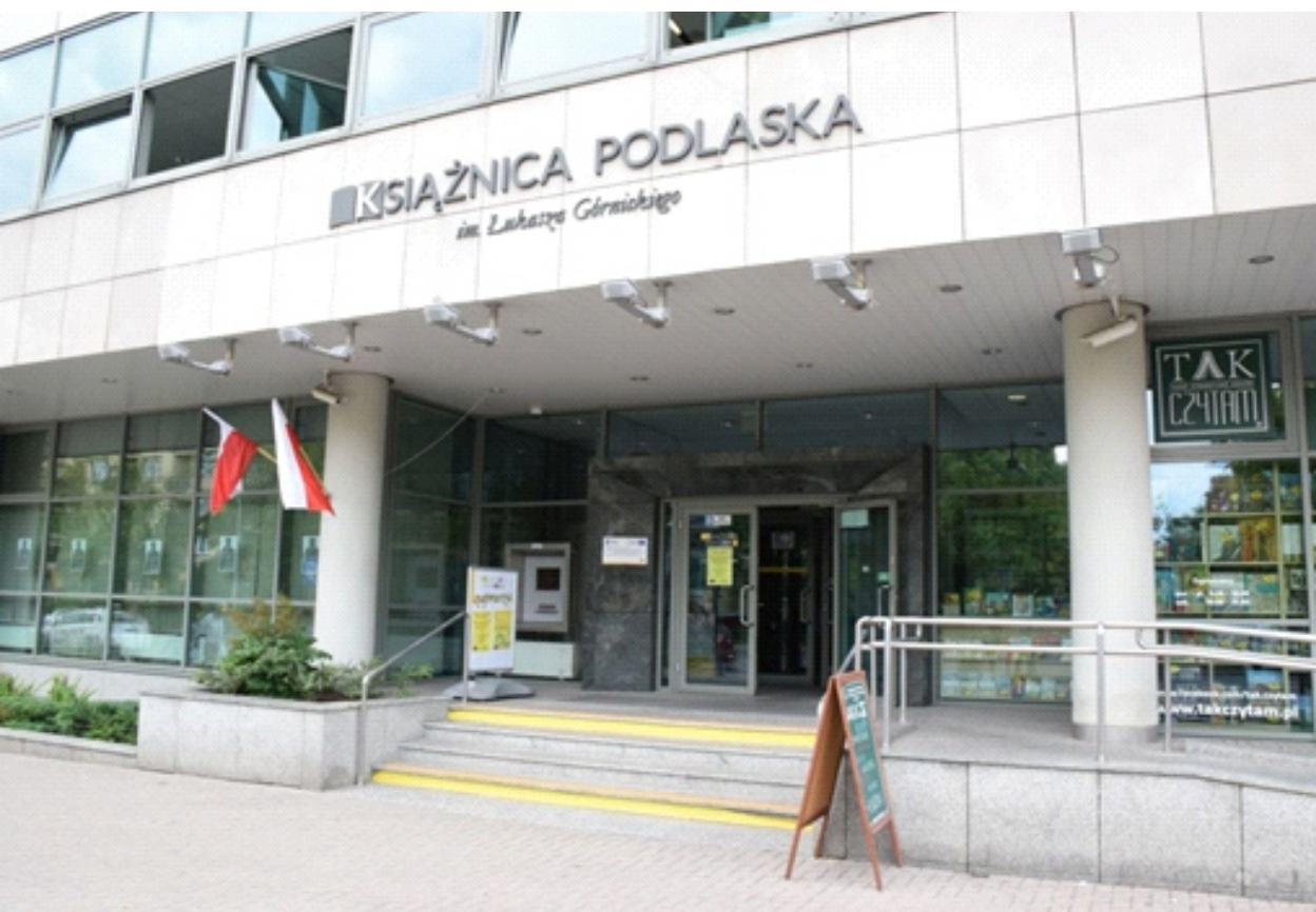
Siedziba Książnicy Podlaskiej im. Łukasza Górnickiego, ul. M. Skłodowskiej-Curie 14a