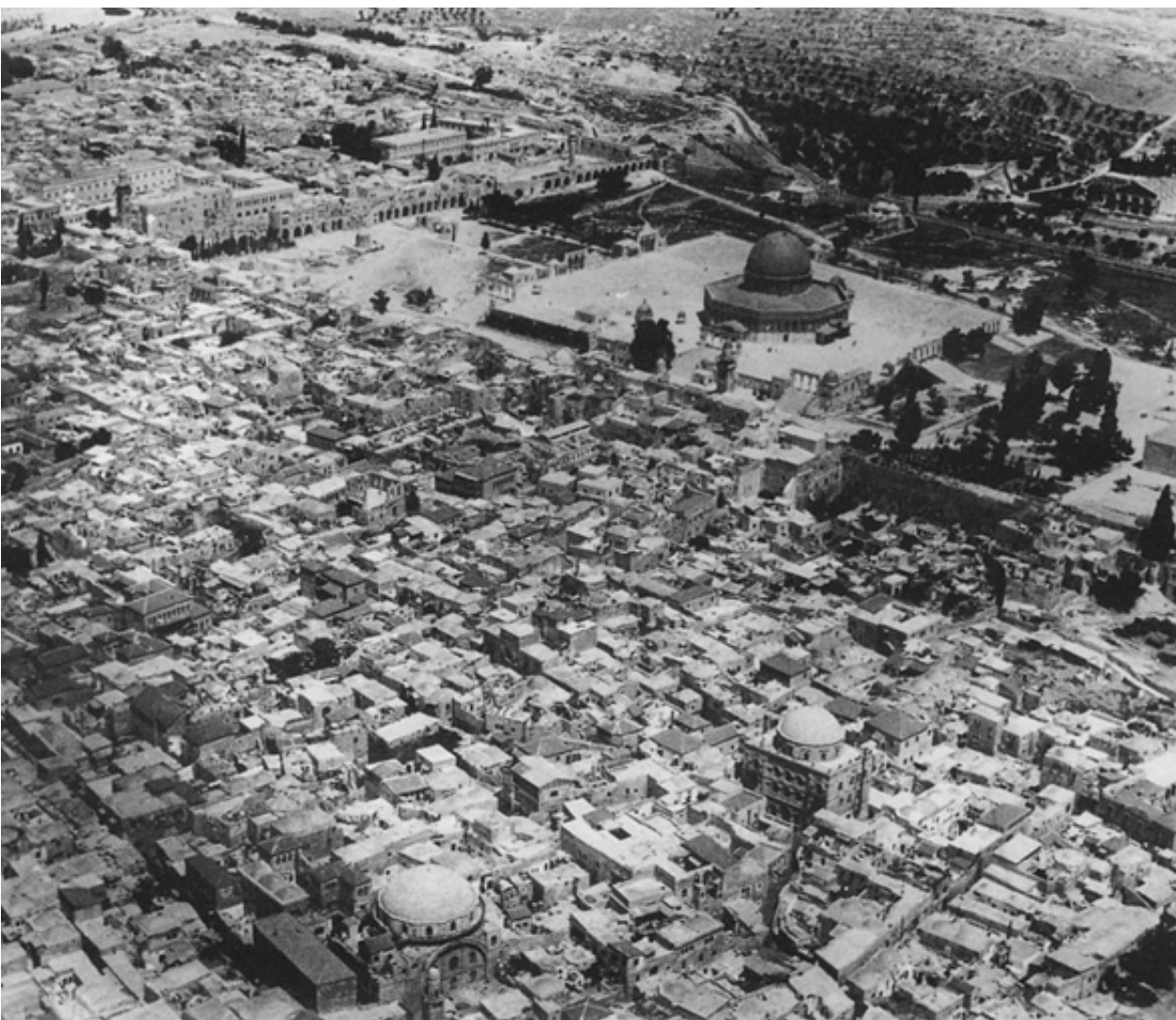
Widok na Stare Miasto w 1937 roku. Na pierwszym planie widoczne synagogi Hurva i Tiferet Israel