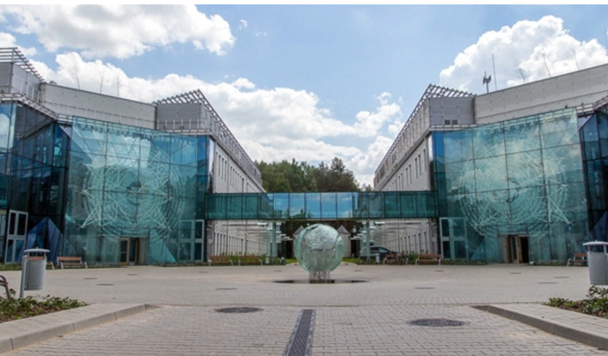
Kampus Uniwersytetu w Białymstoku, ul. K. Ciołkowskiego