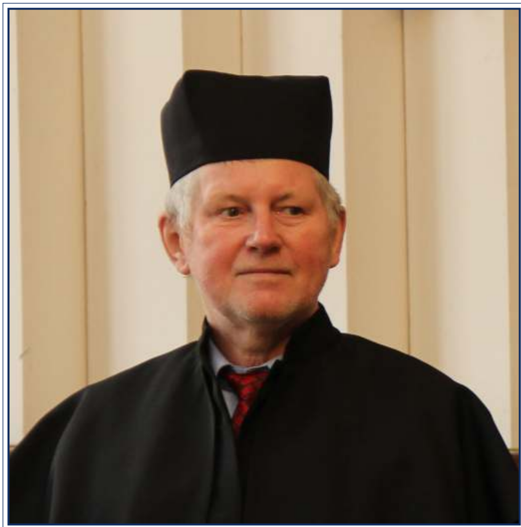
Profesor Bogusław Nowowiejski (1954–2019)