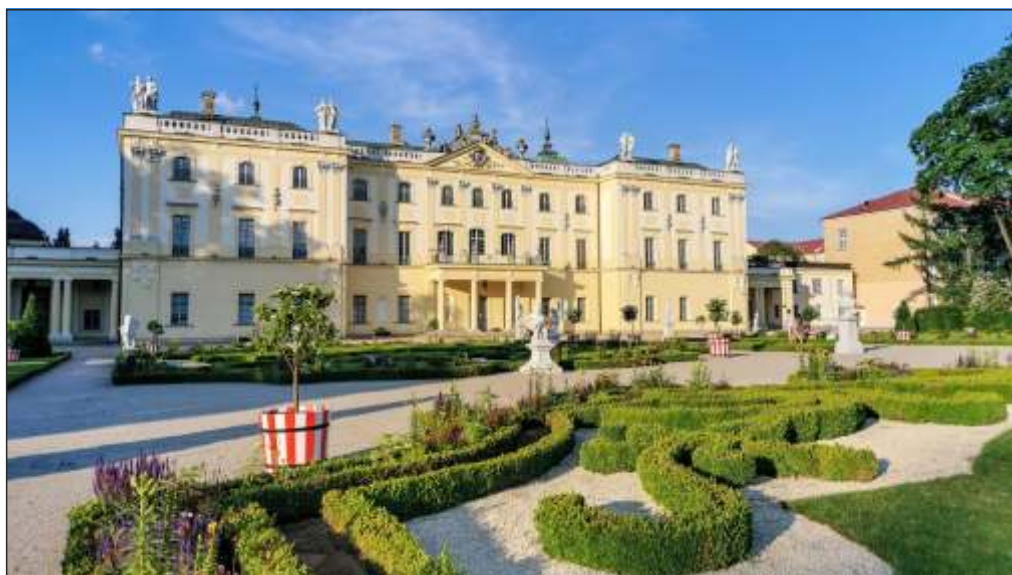
Білосток, Палац Браницьких, вигляд з боку саду, ХХІ століття