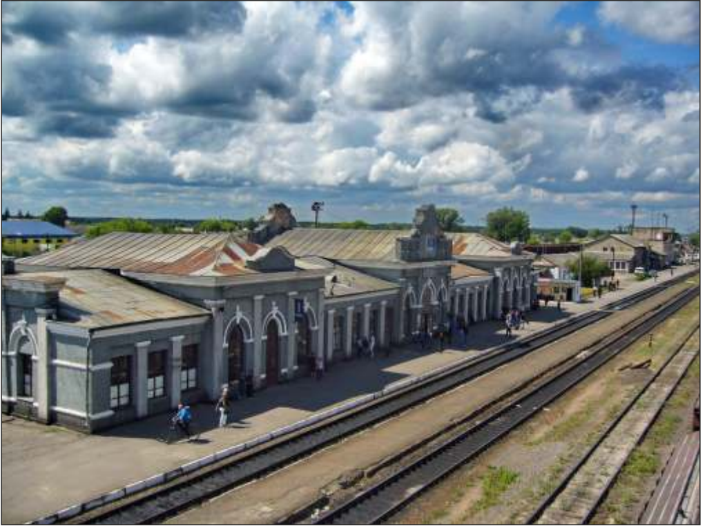
Залізничний вокзал у Сарнах, Україна, XXI століття