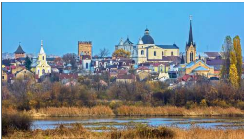
Łuck na Wołyniu, panorama współczesna, XXI wiek