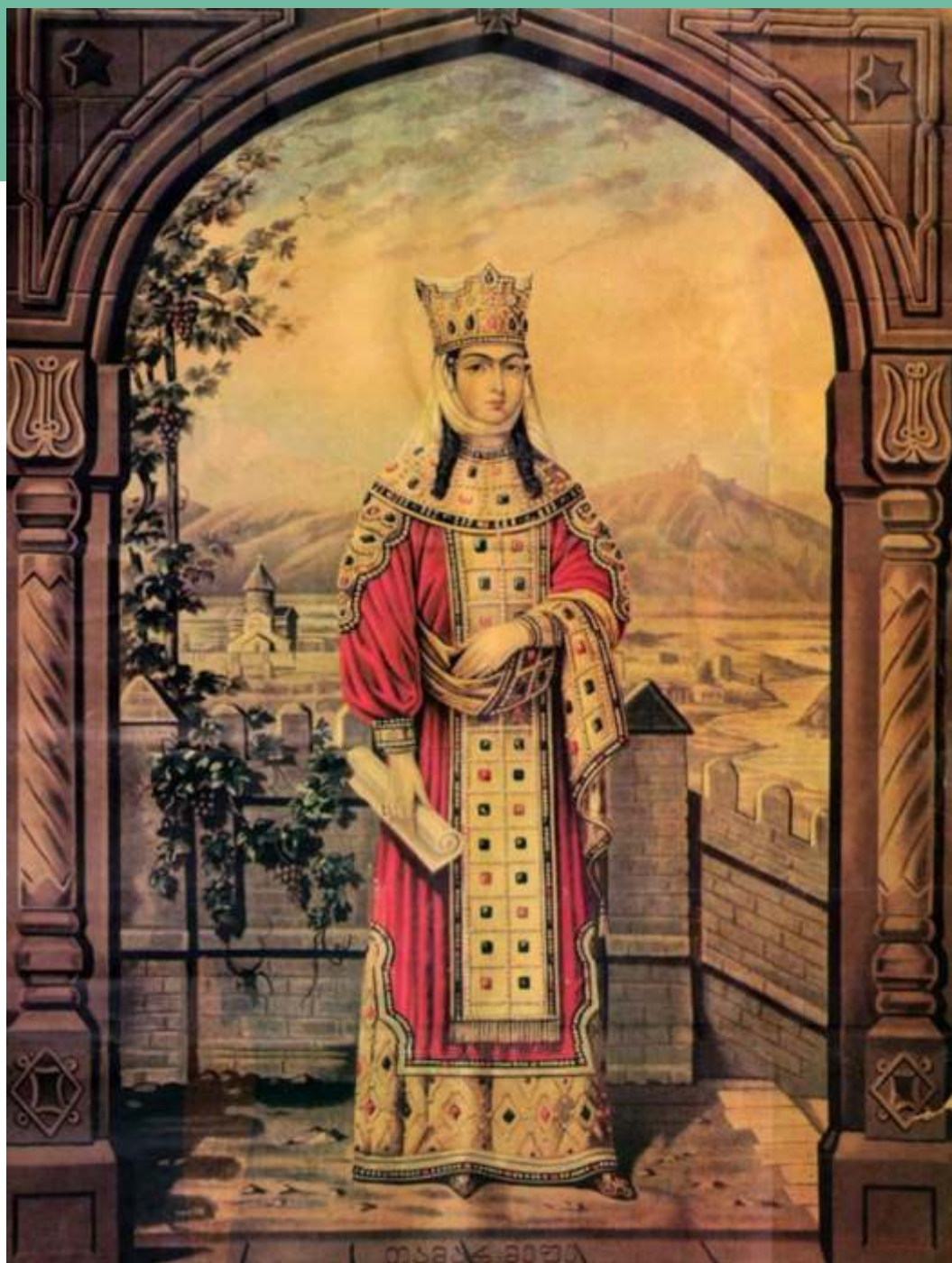
Tamara I Wielka z rodu Bagratydów (1160–1213) – królowa Gruzji od 1184