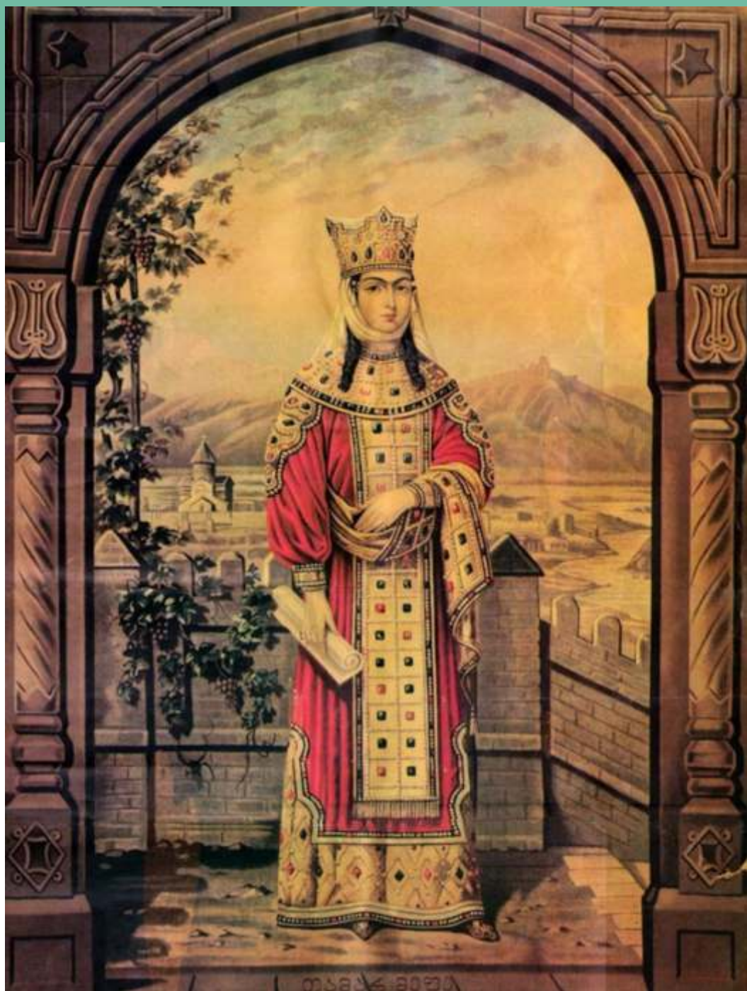
თამარ მეფე ბაგრატიონების შტოდან (1160-1213) – საქართველოს მეფე 1184 წლიდან