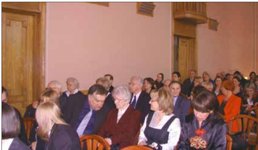
Uroczystość 40-lecia polonistyki białostockiej w Auli Wydziału Filologicznego.