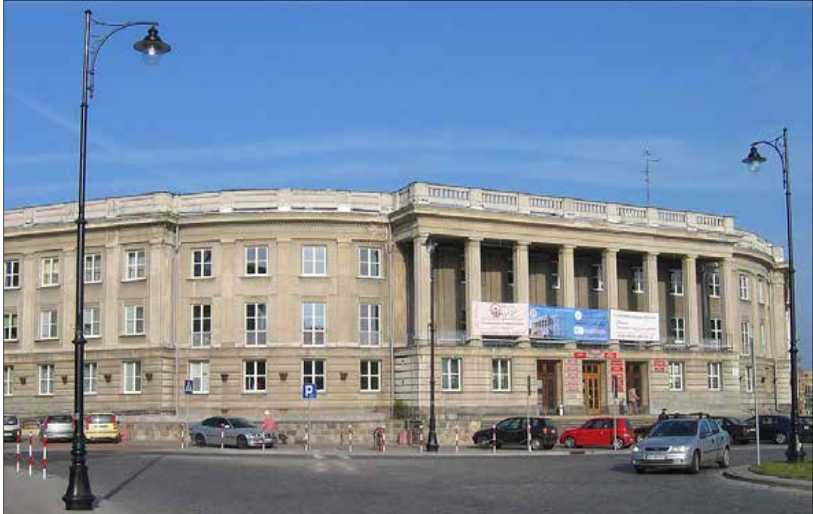
Budynek Wydziału Filologicznego Uniwersytetu w Białymstoku, Plac Niezależnego Zrzeszenia Studentów 1