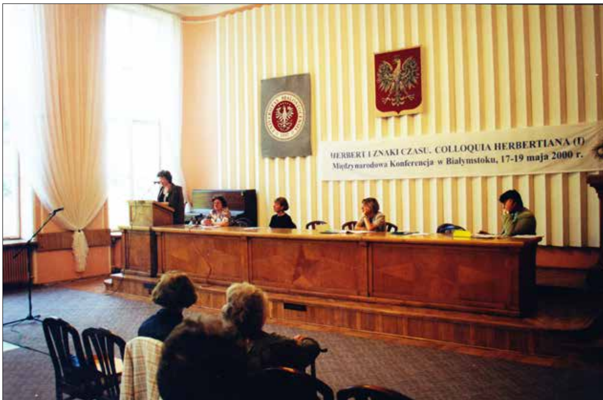
Obrady plenarne Konferencji w Auli Wydziału Filologicznego