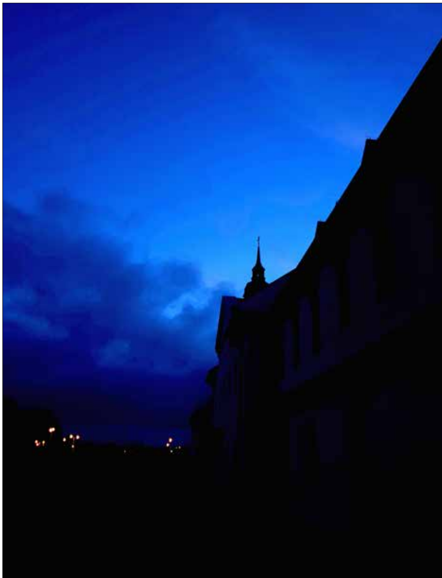
Klasztor w Supraślu o zmroku, 2018.