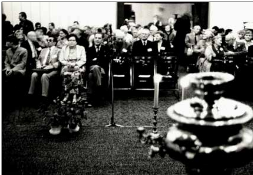
Konferencja Naukowa „Wilno i Kresy Północno-Wschodnie”