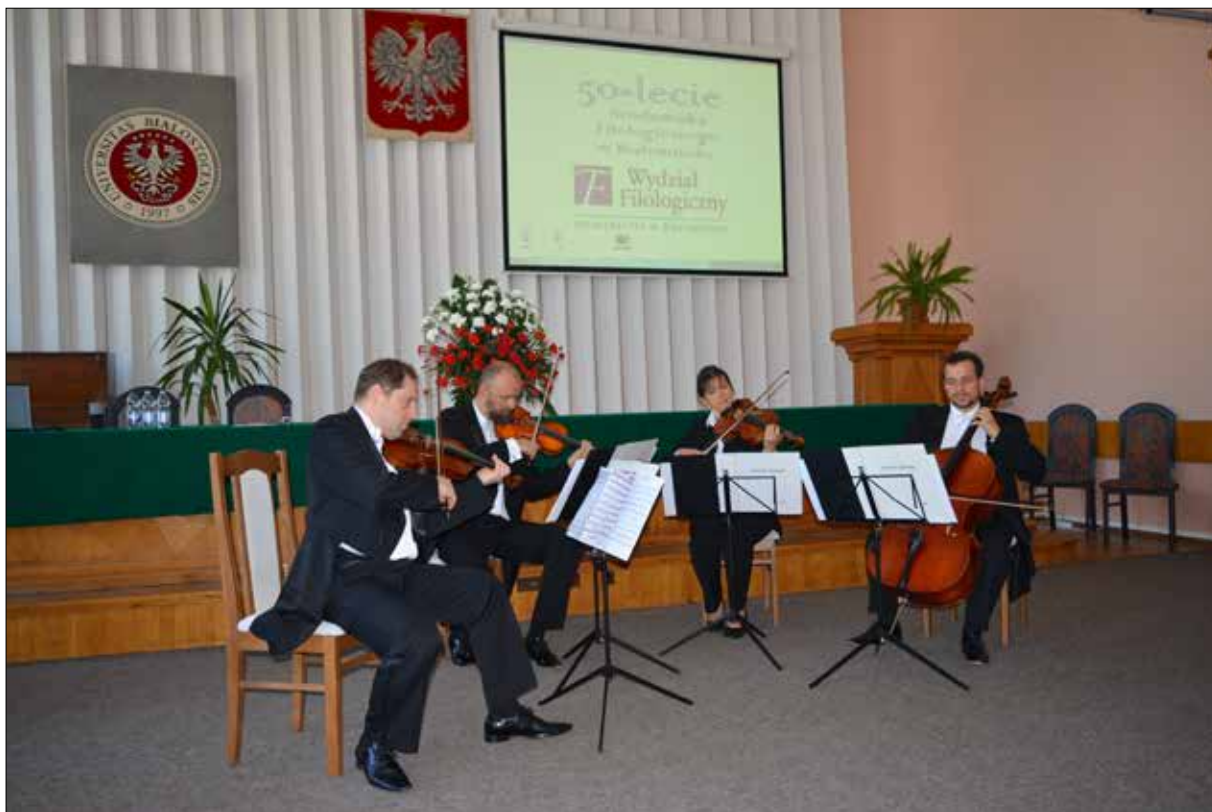
Koncert zespołu „Kwartet Dworski”