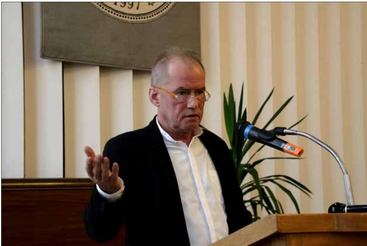
Wykład prof. Ryszarda Nycza (UJ, Kraków): „O dziedzictwie w trzech metaforach”, 29 listopada 2017