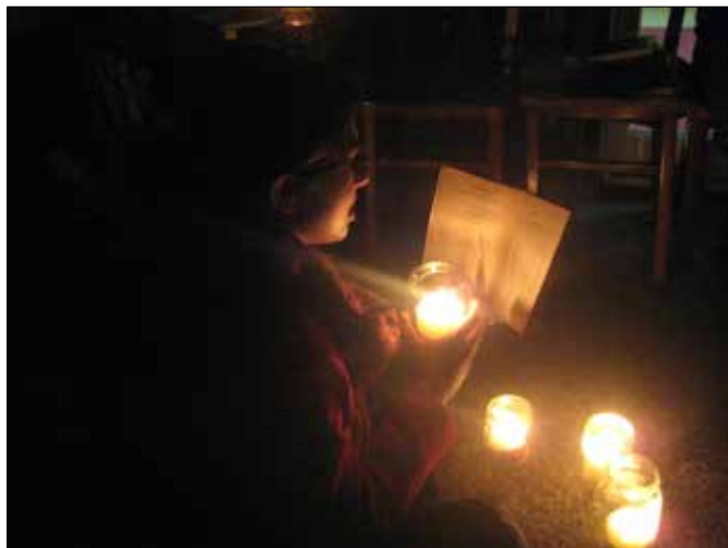
Koło Naukowe Polonistów oraz studenci Wydziału Filologicznego podczas akcji promującej czytelnictwo „Nocne Czytanie”, 30 maja 2014