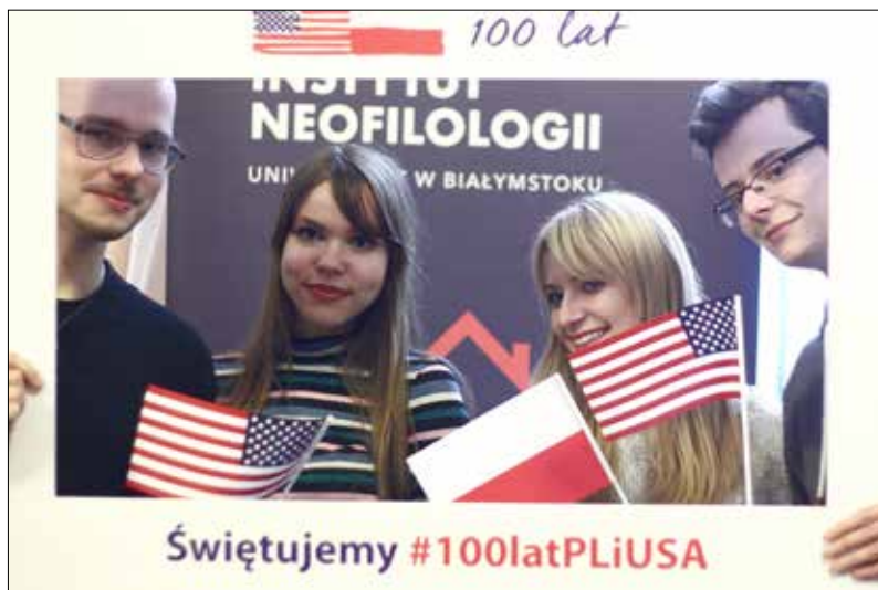
Studenci neofilologii podczas spotkania z okazji 100-lecia współpracy polsko-amerykańskiej