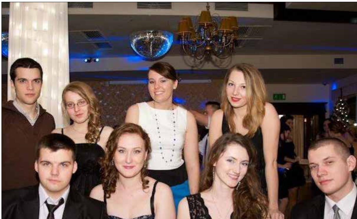
Studenci Wydziału Filologicznego podczas balu