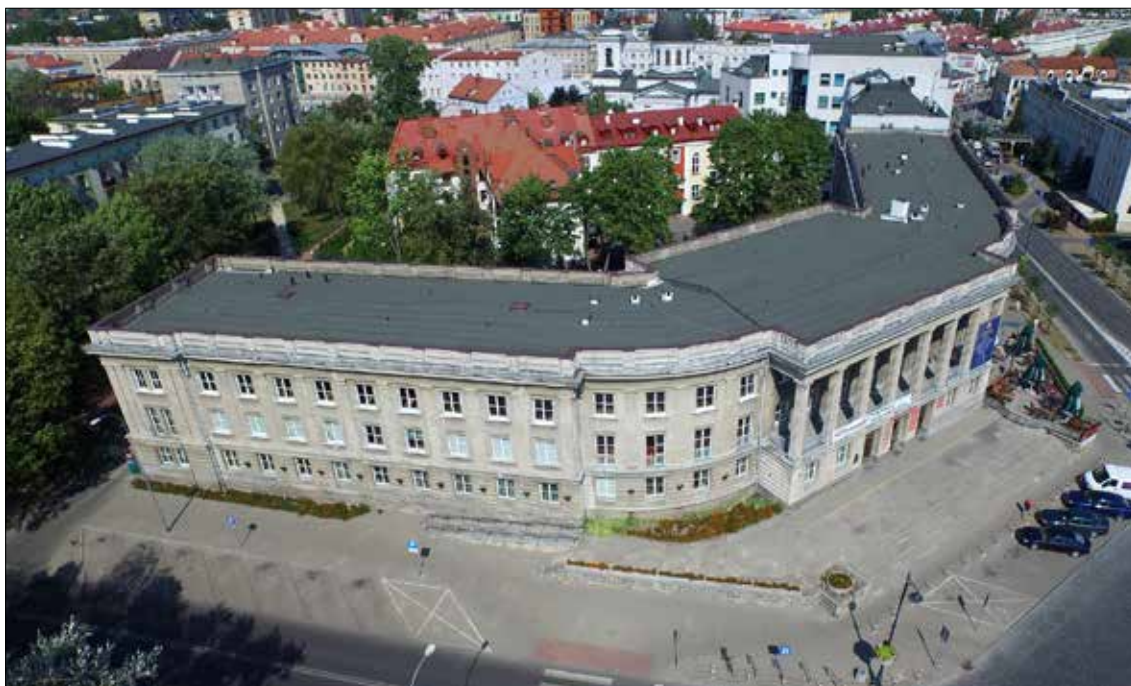
Budynek Wydziału Filologicznego Uniwersytetu w Białymstoku, Plac Niezależnego Zrzeszenia Studentów 1