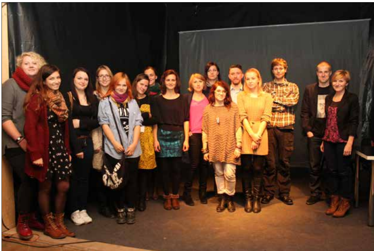
Spotkanie z Romanem Honetem w ramach cyklu „Wiesz wychodzi z domu”, 9 listopada 2012